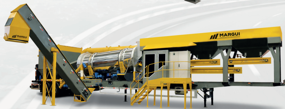
Planta de Asfalto 40 a 60 t/h