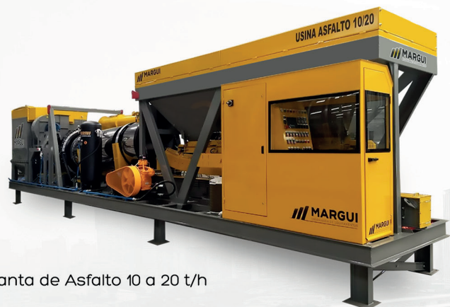
Planta de Asfalto 10 a 20 t/h