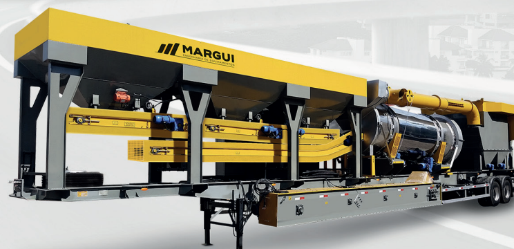
Planta de Asfalto 60 a 80 t/h