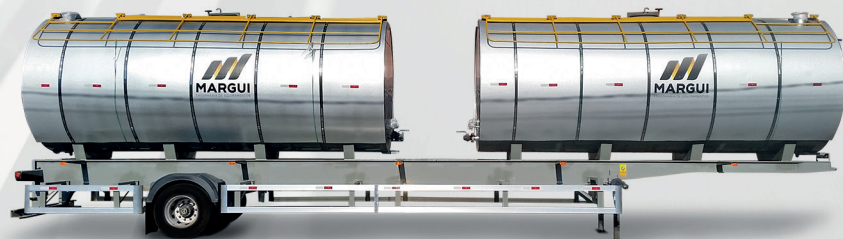
Tanques Móvil e Fijo