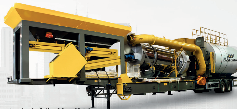
Planta de Asfalto 20 a 40 t/h