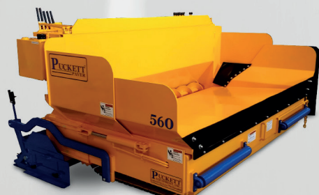
Vibro Terminadora Puckett 560