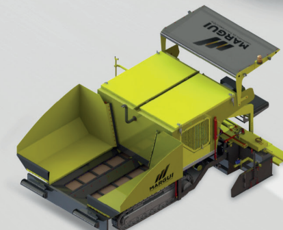
Vibro Terminadora MVA-300